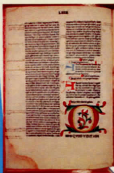
Bibbia, incunabolo del 1497

Intrapresa nell'anno 2000 nell'ambito delle cosiddette "domeniche ecologiche", questa manifestazione della Biblioteca Statale di Montevergine si è nel corso degli anni inevitabilmente trasformata, dovendo fare i conti con problemi di ogni genere, che addirittura nel 2005 non ne hanno consentito la realizzazione. Per i due anni iniziali, le "domeniche ecologiche", organizzate direttamente dai comuni, hanno rappresentato un momento gioioso di aggregazione e di condivisione delle proprie esperienze lavorative, in un contesto in cui anche la Biblioteca, eccezionalmente fuori dalla sua sede tradizionale, ha avuto l'occasione per farsi conoscere ad un'utenza potenzialmente diversa da quella che la frequenta abitualmente. Esauritesi quelle iniziative, la Biblioteca di Montevergine ha rinnovato ogni anno l'evento trasferendosi nel Santuario di Montevergine: una scelta non casuale, che vuole riaffermare l'origine monastica della Biblioteca. Presso lo stand della Biblioteca di Montevergine sarà quest'anno installata una postazio-